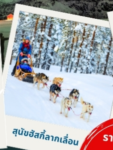
สุนัขฮัสกีลากเลื่อน