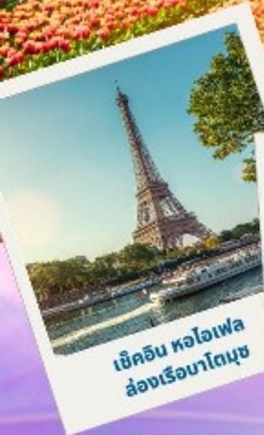
เข็ควิน หอไอเฟล ล่องเรือมาโทมูซ

เทศกาลดอกไม้ เคอเคนฮอฟ 2024 เนเธอร์แลนด์ เบลเยียม ฝรั่งเศส