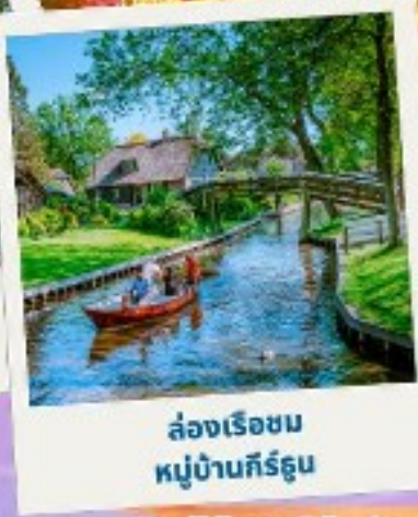
ล่องเรือชม หมู่บ้านกิร์ตุน