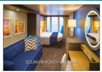
OCEANVIEW WITH BALCONY