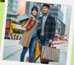
Free time Shopping