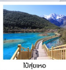
ไป๋สุ่ยเหอ