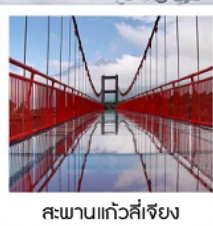
สะพานแก้วลี่เจียง