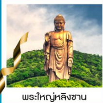
พระใหญ่หลิงซาน

วัดพระใหญ่หลิงซาน / ศาลาฟานกง / จตุรัสหยวนหลง / เมืองโบราณผานหลงกุจิ้น / Tian An 1,000 Trees Square / ตลาดดิ้งหวังเมี่ยว สวนสนุกเซียงไฮ้ดิสนีย์แลนด์เต็มวัน / ถ่ายรูปหอไข่มุก / ลอดอุโมงค์เลเซอร์ / ถนนนานกิง / หาดไว่ทาน / STARBUCKS RESERVE ROASTERY