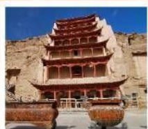
ถ้ำม้อเถา