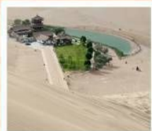
เป็นทรายหิมชახาน