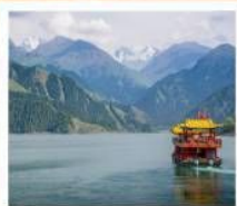
ช่องเรือทะเลสาบเทียนฉือ