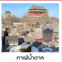
คาเฟ่ชาดำ

หอประชุมเทียนถาน • จัตุรัสเทียนอันเหมิน • พระราชวังโบราณปักกิ่ง • ถนนหวังฝูจิ้ง 798 Art District • พิพิธภัณฑ์ภาพยนตร์จีน • คาเฟ่กาแฟบ้านน้ำตาล พระราชวังฤดูร้อนอวี่เหอหยวน • กำแพงเมืองจีนด้านจวิหยกวง ZHONGHAI DAJI • วัดลามะ • ย่านชานหฺลี่ถุน (POP MART) • ถนนคนเดินที่กู่หฺลี่