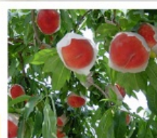
เก็บลูกพีช