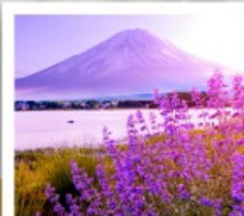
โออิชิ ปาร์ค