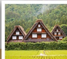
ชิราคาวาโกะ