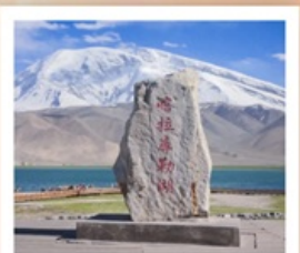
ทะเลสาบกาลากูเล่อ