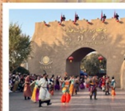
เมืองโบราณคัชการ์