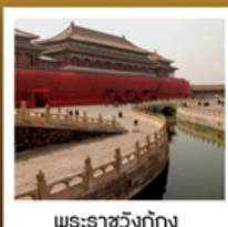
พระราชวังกรุงปักกิ่ง