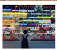
กำแพงมหาวิทยาลัยเหยียนเปียน