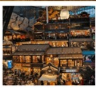
THE HILL CHANGCHUN