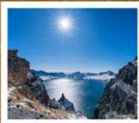
อุทยานอางโป่ซาน