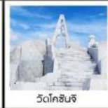
วัดโคชินจิ