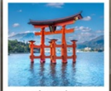
ศาลเจ้าอิตสึคุชิมะ