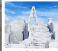
วัดโคซันจิ