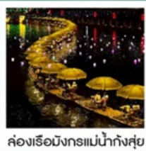
ล่องเรือมังกรแม่น้ำก้งซุย