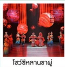
โชว์ซีหลานซาตู้