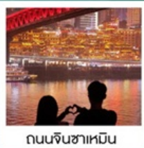
ถนนจินซาเหมิน