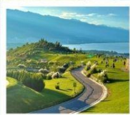
กุขาววันเซียงซาน