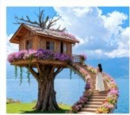
หมู่บ้านเหวินปี้