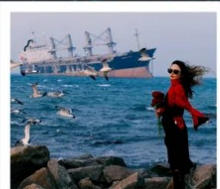
เรือบลูวิส

หอคอยกาลเวลา / รูปปั้นปลาวาฬ / ถนนโบราณเตาหยาง / ย่านสงโขว่ 1920 / เมืองเว่ยไห่ / ถนนฮั่วจวีปา / จตุรัสประตูแห่งความสุข ย่านอันลอฟาง / เรือบลูวิส / หาดซาจื่อโซ่ว / ถนนหลงเจียง / สะพานจันเจียว / หาดไซเบอร์ No. 3 ถนนจงซาน / โบสถ์ St.Emill / จตุรัส 54 / ศูนย์เรือใบโอลิมปิก / พิพิธภัณฑ์มิแยร์ชิงเต่า / ถนนโตตง / ท่าเรือประมงเหยียนโกะ