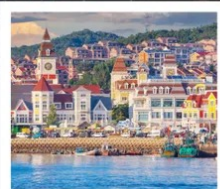
ท่าเรือประมงเหยียนโกะ