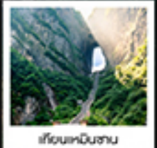
เจียเจียเมืองโบราณ

ทรนดักกบเขมือ / สพานกั๋วเฟี้ยวโกว / เขาคิโยนหนินซาน / ไร่เมืองแก้ว / ประตูสวรรค์ / ไร่ฉางจิงจิงฉงกาว / เขาคิโยนเสี่ยวซาน สวนจอนพะเอ็งต๋อง / ทาฟวาทกราย / เมืองฟูหลงเจิน / ล่องเรือฉางซาแม่น้ำต๋อเจียง / เขามือโบราณฝ่งหวงยกน้ำทำน้ำ