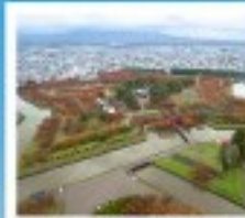
โทริยิวะกะกุ ทาวเวอร์

หุบเขานรกจิโตะคุตานิ / โถงถ้ำฮังโงะคานะโมริ ตลาดเช้าเมืองฮาโกดาเตะ / โทริยิวะกะกุ ทาวเวอร์ ภูเขาไฟอุสุ / จุดชมวิวยุซึกิ / ค่องเรือชมทะเลสาบโทโย สวนอุสึกิโตะ / สวนพฤกษศาสตร์ / เก็บผลไม้ / สัมผัสน้ำพุร้อนที่วิว พิพิธภัณฑ์หอคอยดนตรี / ภาวนิภาอินน้ำโบราณ / โรงปั้นแก้วคิตาฮิชิ เนินพระพุทธรเจ้า / ถนนฮิโอบังทากุทิกจิ / ย่านซูซุกินะ