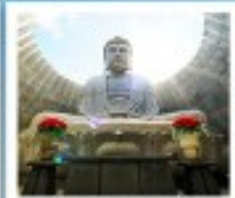
เนินพระพุทธรเจ้า