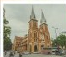
โบสถ์ มดกตงอาน