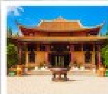
วัดจุ๊กกิม