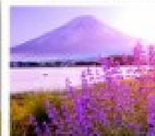
โออิชิ ปาร์ค