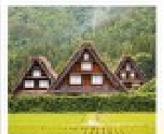
ชิราคาวาโกะ