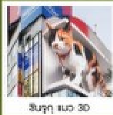
ชินจูกุ แลนด์ 3D

คัมภีร์เมนูคุณพิเศษ บุฟเฟ่ต์ฮาลาลไม่อั้น