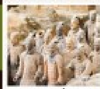
สุถ่าหม่าล่า

วัดสำคัญ / ป่าเจดีย์ / โรงละครแสดงวิทยายุทธสำคัญ / อุทยานหยุนโกซาน ศาลเจ้ากวนอู / กำแพงหล่งเหมิน / สุสานทหารพันชี / ถนนคนเดินวัฒนธรรมต้าถิง โชว์ราชวงศ์ถัง / กำแพงเมืองโบราณซีอาน / วัดสาม / ตลาดมุสลิม