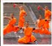
โชว์ราชวงศ์ถัง

PERIOD 1 : 9 - 14 สิงหาคม | PERIOD 2 : 18 - 23 ตุลาคม 2567