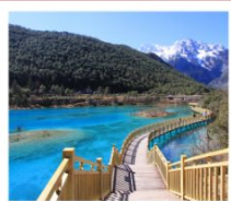
ปู้สูยเหอ