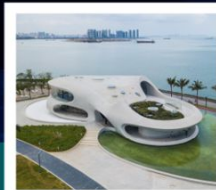
ห้องสมุดหยุนตง