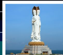
เจ้าแม่กวนอิมหนานซาน