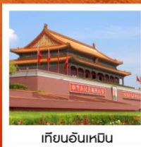
เทียนอันเหมิน

🍴 ลิ้มรสเมนูพิเศษ เปิดปักกิ่ง / สุกี่หม่าล่า