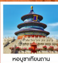
หอขงเทียนถาน