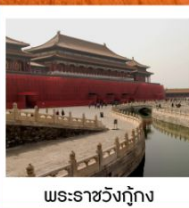
พระราชวังกู่กง