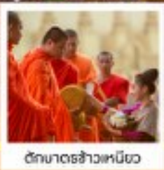
วัดมหาธาตุเมือง