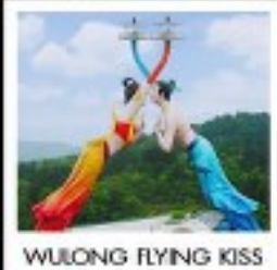
WULONG FLYING KISS