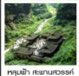
หลุมฟ้า สะพานสวรรค์

พระพุทธรูปทะเลสาบ / หมู่บ้านโบราณฉงชิ่ง อุทยานหลุมฟ้าสะพานสวรรค์ / ระเบียงกระจก / อุทยานเมฆาหวา ภูเขาโถก / Wulong Flying Kiss / เข็มปักถนนคนเดินเฉิงฟางเฉิง เข็มปักหงหยาดิ่ง / มหาศาลประชาชน / เข็มปักไฟฟ้าทะเลสาบ ถนนโบราณจีนแท้ / ศูนย์หมีแพนด้า