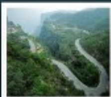
ไท่หิงซาน

หอสูนฮิว / ห้างสรรพสินค้าฟ้างตงหลาย เมืองไคเป็ง / สวนชิงหิงช่างเหอหยวน โชว์ราชวงศ์ซ่ง / แกรนด์แคนยอนไท่หิงซาน หมู่บ้านถั่วเสียงซุม / ถนนลอยฟ้า ถ้ำหินหลงเหมิน / เมืองโบราณทิวอี้ โชว์การแสดงวิทยาศาสตร์ล้ำสมัย