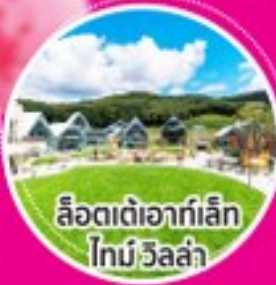
ลือตเตอเอาท์เล็ก ไทม์วิลล่า