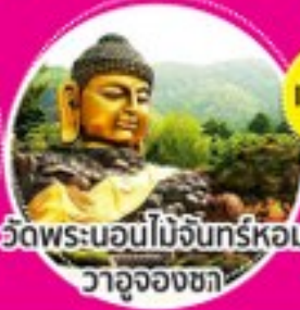
วัดพระนอนไม้จันทร์หอม วาจุงองซา