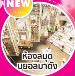
ห้องสมุด บยอลมาดัง