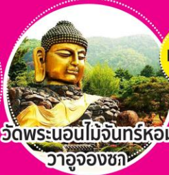
วัดพระนอนไม้จันทร์หอม วาอุจองชก