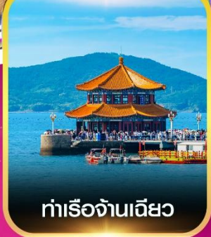
ท่าเรือจันเฉียว