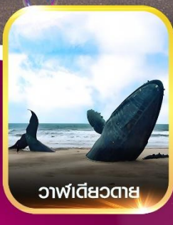
วาฬเดี่ยวตาย

✈️ คอนเฟิร์มออกเดินทาง ทุกพีเรียด 2 ท่านขึ้นไป