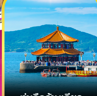
ท่าเรือจันทิว