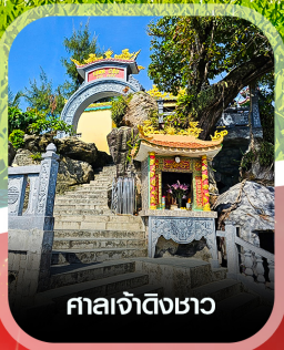
ศาลเจ้าดิ้งซา