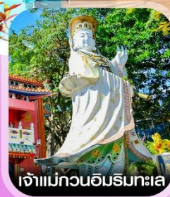
เจ้าแม่กวนอิมรมทะเล

คอนเฟิร์มออกเดินทาง ทุกปีเรียด 2 ท่านขึ้นไป