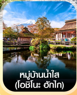
หมู่บ้านน้ำใส (โอะชิโนะ วัทโก)

✈️ คอนเฟิร์ม ออกเดินทาง ทุกพีเรียด 2 ท่านขึ้นไป