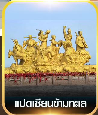
แปดเซียนข้ามทะเล