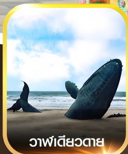
วาฬเดี่ยวตาย