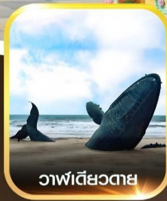
วาฬเดี่ยวตาย

คอนเฟิร์มออกเดินทาง ทุกพีเรียด 2 ท่านขึ้นไป