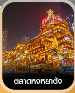
ตลาดหงหยาดัง