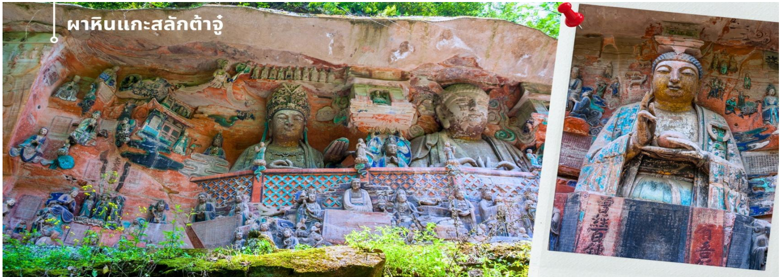
ผาหินแกะสลักต้าจู่

จากนั้นนำท่านเดินทางสู่ ผาหินแกะสลักต้าจู่ เขาเป่าตั้งซาน ผาหินแกะสลักที่ได้รับการบันทึกให้เป็นมรดกโลกทางวัฒนธรรม ที่ผสมผสานบนความเชื่อด้านศาสนาและเป็นงานศิลปะที่ผสมผสาน จุดเด่นของเมืองต้าจู่ที่แสดงถึงงานฝีมือในการแกะสลักถ้ำและผาหิน กลุ่มผาหินแกะสลักต้าจู่มีมากกว่า 70 จุด ชิ้นงานมากกว่า 1 แสนชิ้น ในนั้นถือว่า “เป่าตั้งซาน” และ “เป่ยซานม่อหย่า” สองสถานที่นี้มีหินแกะสลักชิ้นซึ่มากที่สุด เน้นไปทางพุทธศาสนาเป็นแบบอย่างของถ้ำหินแกะสลักของประเทศจีนในยุคศิลปะตอนปลาย และ หินแกะสลักเป่าตั้งซาน เป็นตัวหลักในการขุดเจาะแกะสลักอย่างยากลำบากกว่า 70 กว่าปี หินแกะสลักที่นี้จะแกะตามรูปลักษณะของตัวภูเขา ด้วยความปราณีต และพิถีพิถัน มีความสวยงามเพียบพร้อมด้วยเนื้อหาลอกเล่าและเตือนสติผู้พบเห็น และยังมีการจัดแบ่งงานฝีมือของแต่ละยุคไว้ เป็นการประชันของช่างในแต่ละยุค ด้านใต้จะเป็นงานในยุคถึงตอนปลาย จนถึง ยุคห้ารัชกาล และ ด้านเหนือจะเป็นงานในสมัย ช่งเหนือซึ่งได้ ซึ่งงานฝีมือในแต่ละยุคจะสะท้อนความเป็นอยู่และค่านิยมที่ไม่เหมือนกัน