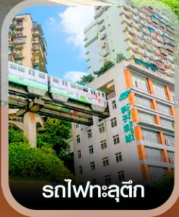
รถไฟฟ้าลู่ตึก

✈️ คอนเฟิร์มออกเดินทาง ทุกพีเรียด 2 ท่านขึ้นไป