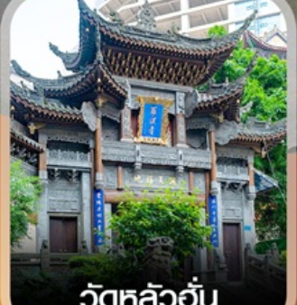
วัดหลิวอัน