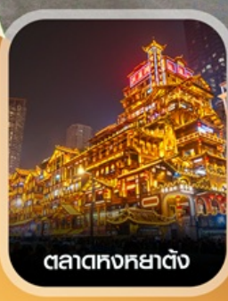
ตลาดหงหยาดัง