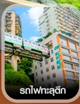
รถไฟทะลุติ๊ก

✈️ คอนเฟิร์มออกเดินทาง ทุกพีเรียด 2 ท่านขึ้นไป