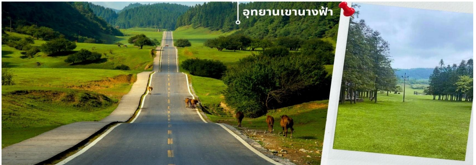
อุทยานเขานางฟ้า

นำท่านเดินทางสู่ อุทยานเขานางฟ้า (รวมรถราง) เป็นสถานที่ท่องเที่ยวชื่อดังของเมืองอู่หลง มณฑลฉงชิ่ง ประเทศจีน ที่ได้รับฉายาว่า “สวิตเซอร์แลนด์แห่งตะวันออก” เพราะมีทุ่งหญ้ากว้างใหญ่ ป่าสนเขียวขจีรายล้อมไปด้วยภูเขาทำให้อุทยานแห่งนี้มีอากาศที่เย็นสบายด้วยอุณหภูมิเพียง 24 องศาเซลเซียสในช่วงฤดูร้อน ในฤดูหนาวที่นี่กลายเป็นลานหิมะขนาดใหญ่ จึงเป็นหนึ่งในจุดหมายยอดนิยมของนักท่องเที่ยวทั้งในและต่างประเทศ โดยเฉพาะผู้ที่ชื่นชอบธรรมชาติและการเล่นสกี ในการเดินทางเข้าไปในอุทยาน สามารถนั่งรถรางเข้าไปโดยใช้เวลาประมาณ 20 นาที