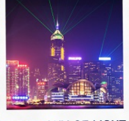
SYMPHONY OF LIGHT