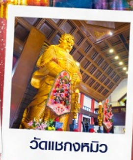
วัดเชกวงหมีว