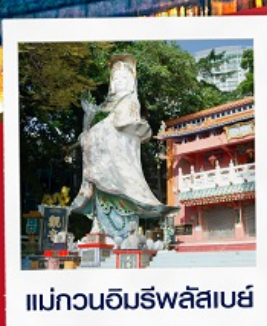
แม่กวนอิมริฟลัสเบย์