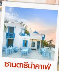
คาเฟ่ริมน้ำกาแฟ

บุฟเฟ่ต์นานาชาติ บนบาน่าฮิลล์ และ บุฟเฟ่ต์ชาบู-ปิ้งย่าง