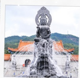
วัดพุทโธ