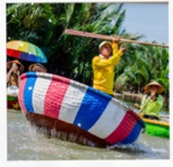
เรือกระดัง