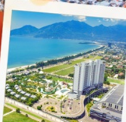
Mikazuki Japanese Resorts & Spa