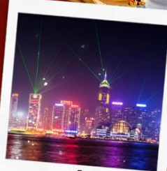
ชมโชว์ SYMPHONY OF LIGHT