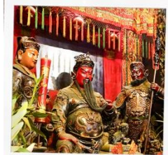
เทพเจ้ากวนอู วัดกวนไท