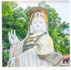
เจ้าแม่กวนอิมธิพลัสสมัย