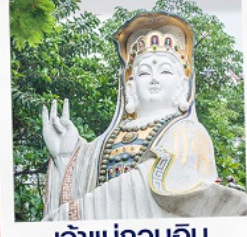
เจ้าแม่กวนอิม รั้วลี้สมย์