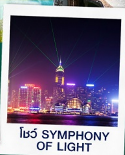
โชว์ SYMPHONY OF LIGHT