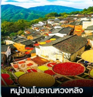
หมู่บ้านโบราณหวงหลิง (หมู่บ้านตากพรึก)