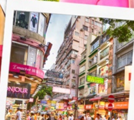
ช้อปปิ้งย่านมงก๊ก