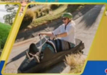
เล่นลู่ที่ควีนส์ทาวน์

✈ บินภายใน (เที่ยวสุดคุ้ม) พักโรงแรม 4 ดาว ★★★★★