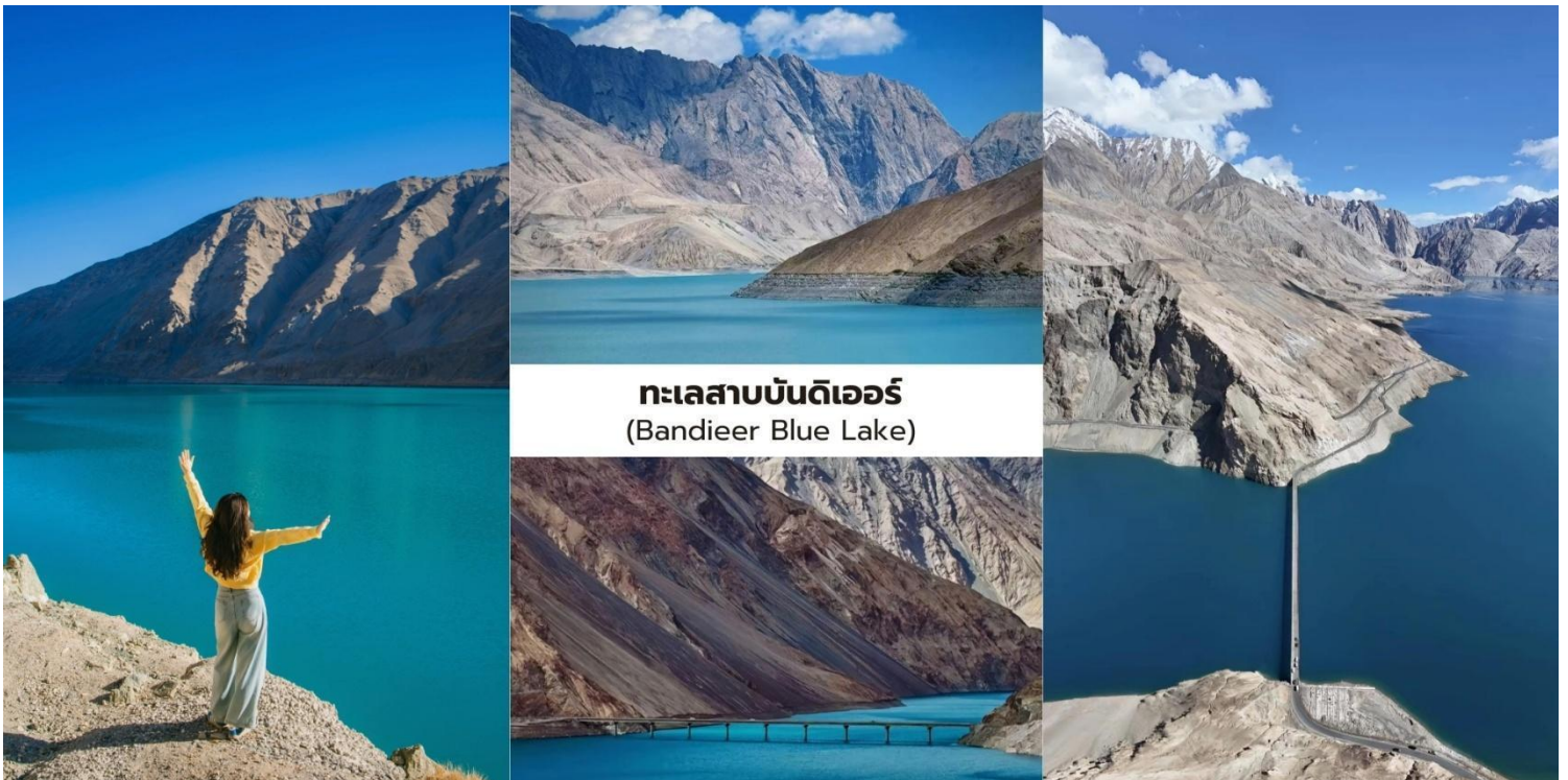
ทะเลสาบบันด์เอร์ (Bandieer Blue Lake)

นำท่านเที่ยวชม ทะเลสาบบันด์เอร์ (Bandieer Blue Lake) ทะเลสาบสีฟ้าใสที่ตั้งอยู่บน ที่ราบสูงปามิร์ เกิดจากน้ำละลายของธารน้ำแข็งโบราณทำให้พื้นน้ำมีสีฟ้าครามเข้มตัดกับภูเขาหินสีน้ำตาลที่โอบล้อมอยู่โดยรอบ เกิดเป็นทัศนียภาพที่งดงามและแปลกตา พื้นน้ำของทะเลสาบสามารถเปลี่ยนเฉดสีตามแสงและสภาพอากาศบางช่วงจะปรากฏเป็น สีเขียวมรกต และบางช่วงเป็น สีน้ำเงินครามลึก สะท้อนเงาของภูเขาและท้องฟ้าอย่างสวยงามทำให้ทะเลสาบแห่งนี้ถูกขนานนามว่าเป็น “อัญมณีแห่งที่ราบสูงปามิร์” บริเวณโดยรอบยังคงความเงียบสงบและธรรมชาติที่บริสุทธิ์เหมาะสำหรับการชมวิวและถ่ายภาพถือเป็นหนึ่งใน จุดชมวิวธรรมชาติที่สวยงาม และยังไม่เป็นที่รู้จักมากนักของจีนเจียง ซึ่งนักท่องเที่ยวทั่วไปยังเดินทางมาไม่ถึงมากนัก