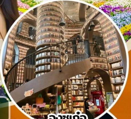
จงซูเก๋อ