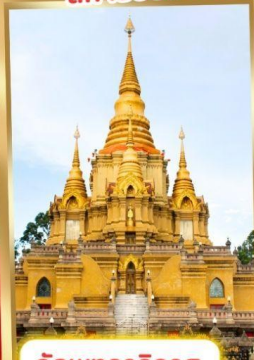
วัดพุทธาริวาส