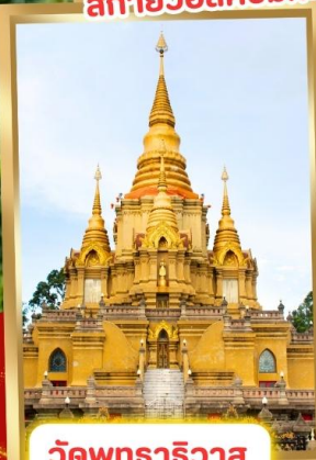
วัดพุทธาริวาส