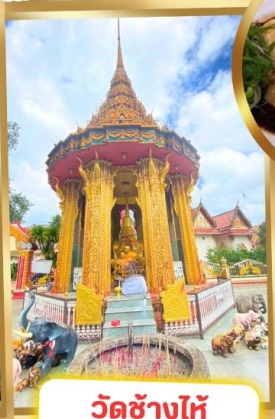
วัดช้างไห้