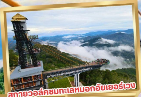
สกายวอล์คชมทะเลหมอกอัยเยอร์เวง

ร่วมโครงการ ลดหย่อนภาษี ลดสูงสุด 15,000.-