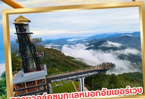
สกายวอล์คชมทะเลหมอกอัยเยอร์เวง