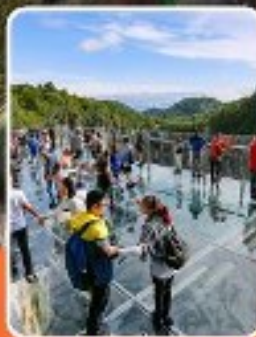
ระเบียบแก่ว๋หลง

ภูเขาหว่าอูซาน (รวมขึ้นกระเช้าไป-กลับ) - อุทยานเขานางฟ้า อุทยานหลุมฟ้าสะพานสวรรค์ - ระเบียบแก่ว๋หลง - รถไฟฟ้าทะเลตึก หงหยาดัง - วัดเป้ากั๋ว - หลวงพ่อโตเสอซาน - วัดต้าอิว หมี่เพนค้ายักษ์ ซุปปิ้ง ถนนคนเดินซุนซู่โก่กู๋หลี่